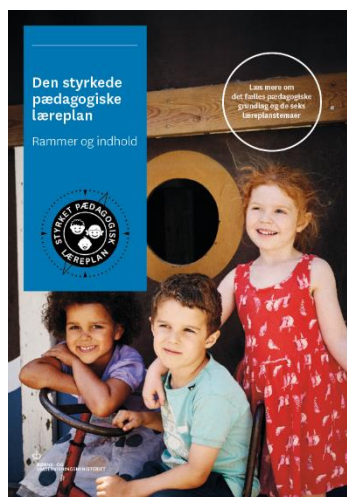
Den styrkede pædagogiske læreplan, Rammer og indhold

Inden for de krav, der følger af dagtilbudsloven, er det op til jer at beslutte, hvordan I konkret vil arbejde med den pædagogiske læreplan. Jeres læreplan skal være et dynamisk og meningsfuldt dokument, som peger fremad, og som I kan bruge aktivt i den løbende udvikling af den pædagogiske kvalitet og jeres pædagogiske praksis.